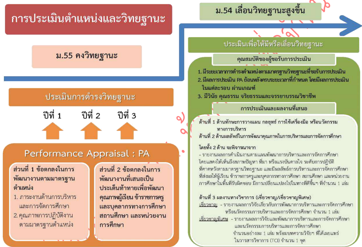
แผนภาพที่ 3 ความเชื่อมโยงของระบบการประเมินตำแหน่งและวิทยฐานะข้าราชการครูและบุคลากรทางการศึกษา ตำแหน่งผู้บริหารการศึกษา

หลักเกณฑ์และวิธีการประเมินตำแหน่งและวิทยฐานะข้าราชการครูและบุคลากรทางการศึกษา ตำแหน่งผู้บริหารการศึกษา ตามหนังสือสำนักงาน ก.ค.ศ. ที่ ศธ 0206.4/ว 12 ลงวันที่ 20 พฤษภาคม 2564 จะเป็นประโยชน์กับผู้เรียน ครู สถานศึกษา หน่วยงานการศึกษา และผู้ที่เกี่ยวข้อง ดังนี้