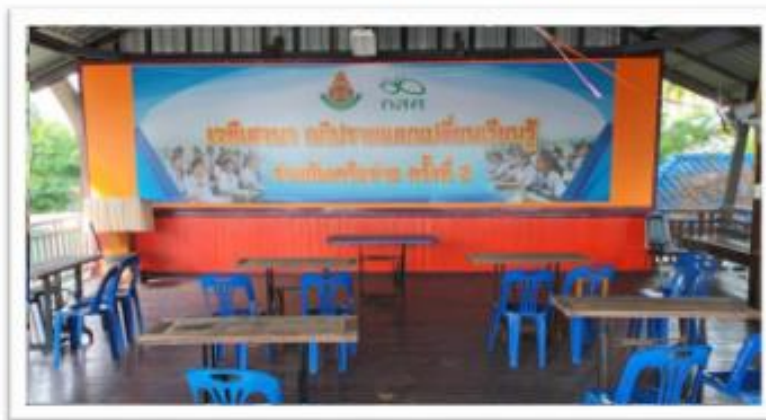
ห้องประชุมจามจุรี